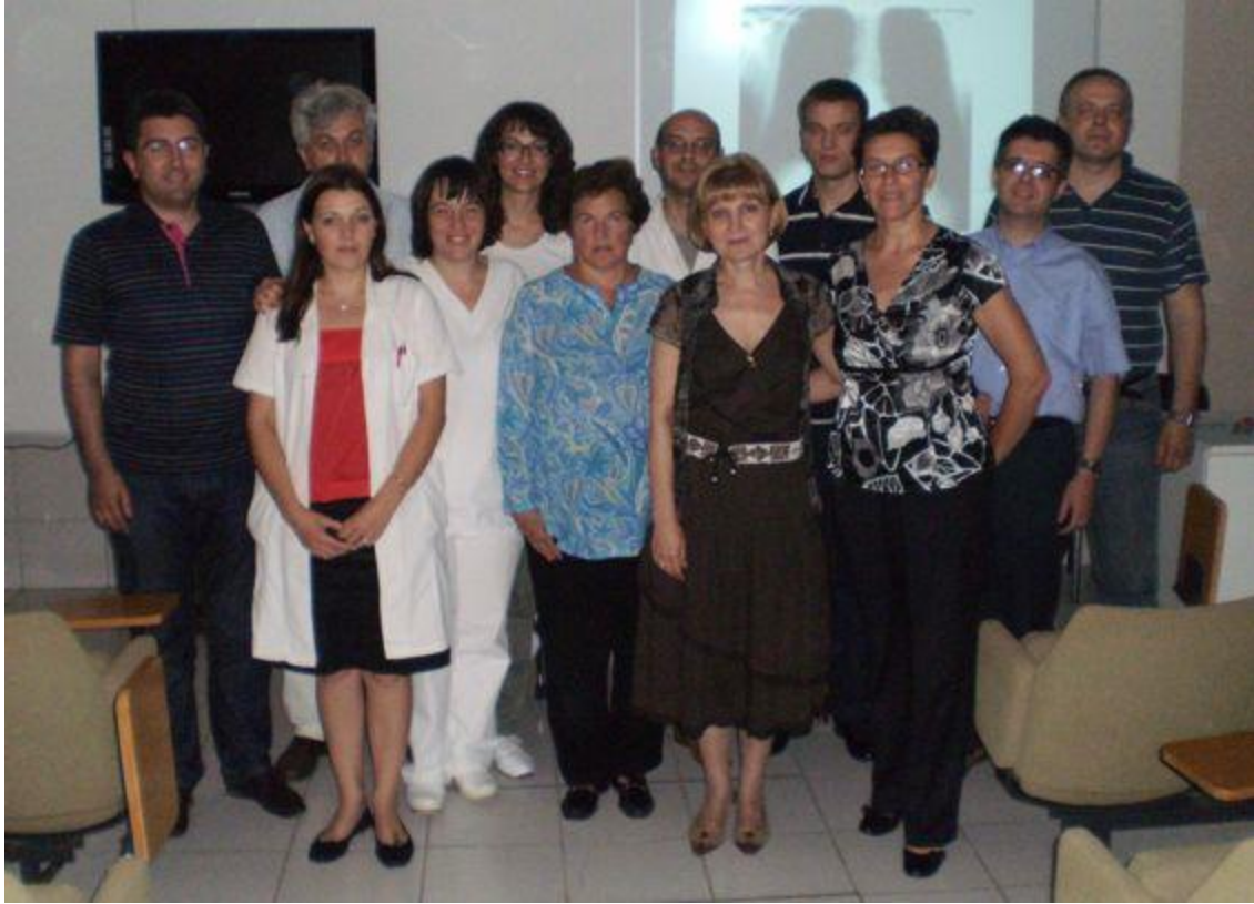
Део учесника конзилијума након завршетка рада са Проф. др Јане Somerville